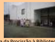
Chegada da Procissão à Biblioteca