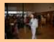
Público / Instalação