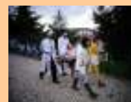
Andor da Procissão dos Livros