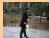
O Livro Inclinado