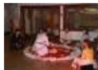
Iluminados por um Livro I

A Instalação “Iluminados por um livro” , apogeu da performance que percorreu as ruas da cidade de Viseu (Portugal) e, posteriormente, celebração do dia mundial do livro, provocou profundamente centenas de utilizadores de duas instituições: a Biblioteca Municipal de Viseu e a Escola Superior de Educação do Instituto politécnico de Viseu.