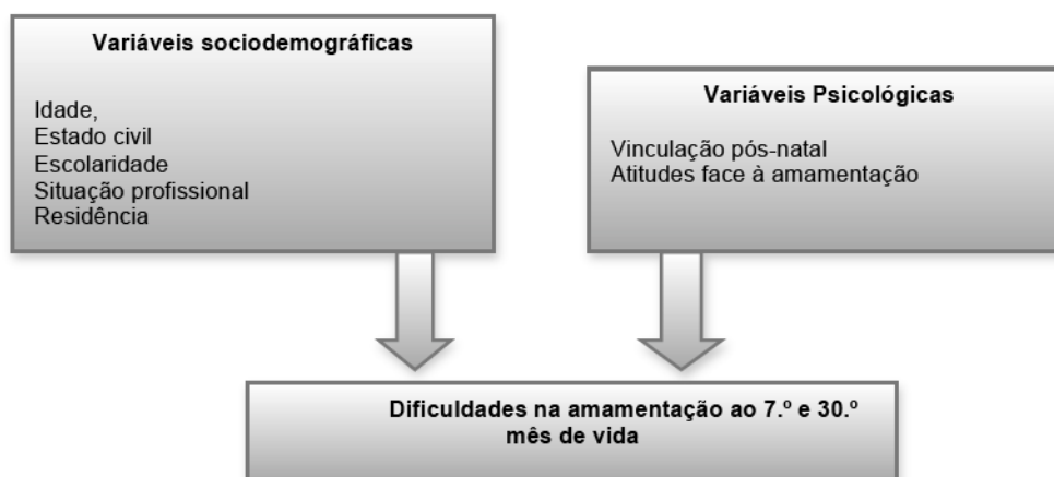
Figura 1. Representação esquemática da relação prevista entre as variáveis estudadas na investigação empírica

Concebeu-se um estudo de natureza quantitativa, não experimental, longitudinal de curta duração em painel e descritivo-correlacional. É um estudo quantitativo pois pretende garantir a precisão dos resultados, para se evitar distorções de análise e interpretação. Insere-se no tipo de investigação não experimental, pois não procura manipular as variáveis em estudo, embora seja nossa intenção obter evidências para explicar por que ocorre um determinado fenómeno, ou seja, proporcionar um certo sentido de causalidade (Sampieri, 2003).