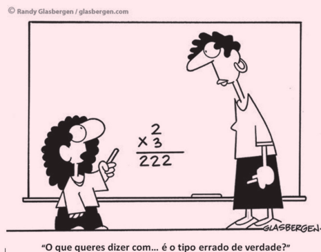
Figura 1. Tarefa “Regularidade irregular”