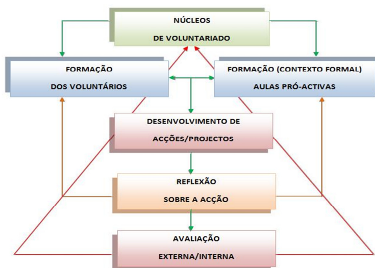
Figura 3 – Voluntariado e avaliação (fonte própria)

testando hipóteses 7 , reflectindo sobre as acções desenvolvidas, o que permite a todos os stakeholders uma capacidade efectiva e contínua de avaliar os resultados obtidos na formação (ensino colaborativo e tradicional) e no voluntariado.