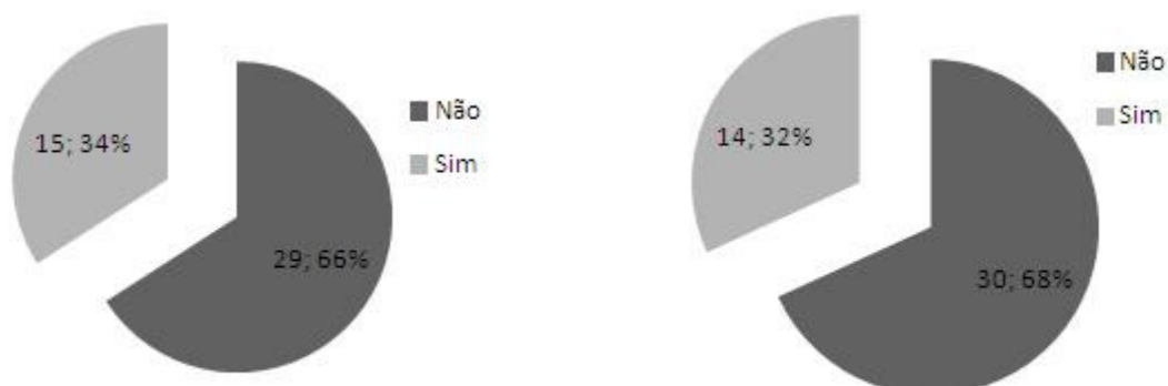
Figura 3 (A e B) – Ligações estabelecidas com fornecedores de bens e serviços ao empreendimento (3A) e com outras entidades com vista ao desenvolvimento do empreendimento de TER (3B)

ligações com entidades exteriores para fornecimento de bens e serviços ao empreendimento, estas revestem um carácter informal e esporádico .