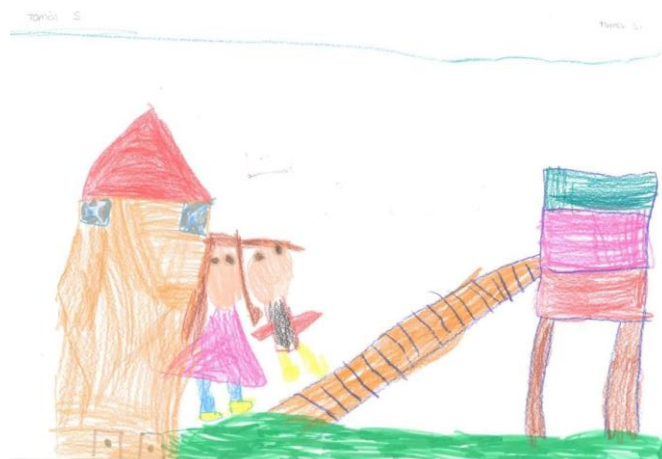
Figura 2 - Representação do espaço exterior, no qual a criança se encontra a brincar com outra criança (Tom4M)

Como já foi referido, as crianças revelaram gostar de brincar no exterior, no parque infantil, pois é o local onde têm oportunidade para correr, saltar, brincar com crianças de outras salas e usufruir de equipamentos como o escorrega, os baloiços. O mesmo é possível observar-se nos desenhos acerca do Jardim de Infância pois, sete das crianças fizeram referência ao espaço exterior.