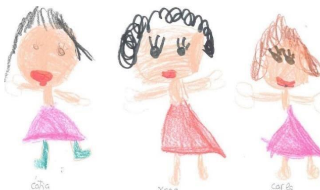
Figura 4 - Representação das três auxiliares da ação educativa a conversar (Bea4F)

Este discurso que nos dá a entender que nem sempre existe interação entre as auxiliares da ação educativa e as crianças encontra-se também plasmado nos desenhos realizados pelas crianças, sendo que uma delas representou as três auxiliares da ação educativa a conversarem entre si.