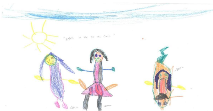
Figura 3 - Representação das auxiliares da ação educativa (Sar4F)

Duas das crianças entrevistadas deram respostas um pouco genéricas pois uma delas não foi capaz de dar uma resposta concisa e onde revelasse um motivo para gostar do seu Jardim, dizendo apenas - “Sim, porque é muito fixe” (Lar6F). A outra criança mencionou um facto interessante que diz respeito ao Jardim anteriormente frequentado, onde o obrigavam a apanhar o seu próprio vomitado, um dos motivos que o levou a sair do mesmo – “Gosto mais desta do que da outra! Porque tenho muitos amigos e as professoras ajudam. Na outra escola mandavam limpar o meu vomitado” (Fra6M).