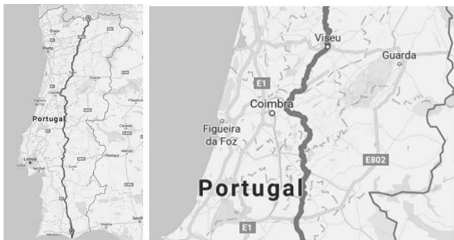
Figura 2 – Rota da EN2

patrimónios, alguns dos quais classificados pela UNESCO, que proporcionam uma experiência autêntica de territórios ainda pouco visitados. Este projeto pode ser apoiado pela Associação de Municípios da Rota da EN2, que tem como principal objetivo tornar esta rota cultural numa rota segura, cómoda e confiável e que proporcione uma forte experiência de contacto com as comunidades locais.