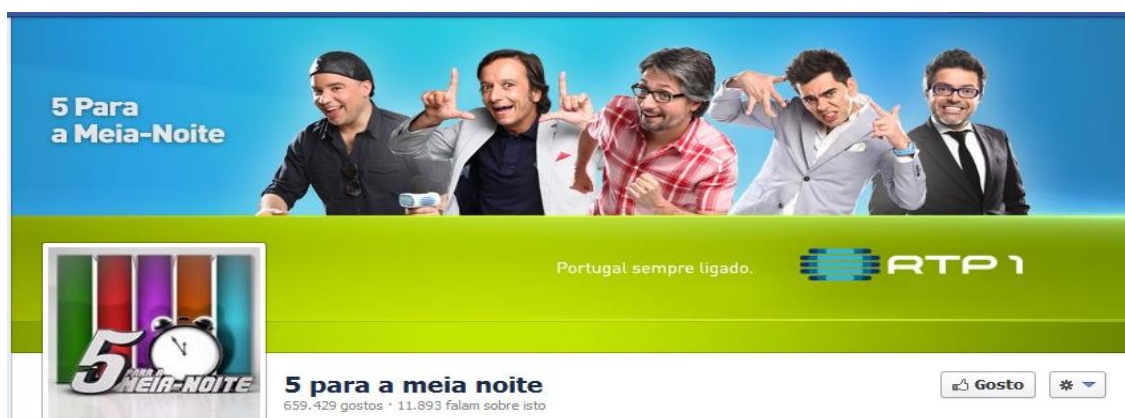
Figura 3. Perfil de Facebook do programa “5 Para a Meia Noite”

Segundo os dados recolhidos em novembro de 2012, o programa de televisão que tinha mais fãs na sua página de facebook era o “5 Para a Meia Noite” da RTP1 (figura 3), com 625.539 fãs; já no twitter o programa do Bruno Aleixo era o que tinha mais seguidores com 41.970. Quanto aos programas de rádio, o que tem mais fãs no facebook é a “Caderneta de Cromos” da Rádio Comercial; dos programas que possuem página no twitter o que tem mais seguidores é o “Prova Oral” da Antena 3 (anexo 1).