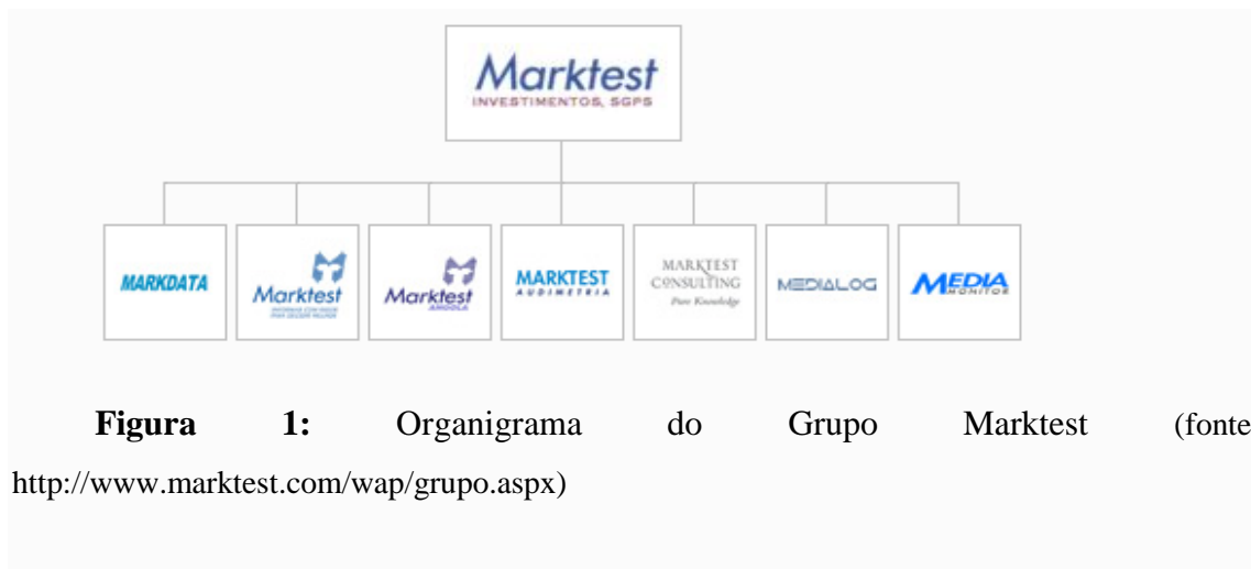
Figura 1: Organograma do Grupo Marktest (fonte:

http://www.marktest.com/wap/grupo.aspx )