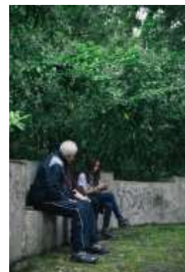
Fig. 1. Atividades: W1 – biblioteca; W2 – centro histórico; W3 – Parque do Fontelo

A recolha de dados foi feita com base na observação naturalista dos investigadores do projeto, na análise de conteúdo das histórias produzidas e com a aplicação de um pequeno questionário aos participantes. Para o caso deste estudo, e no sentido de validar o significado do património para as práticas intergeracionais, foi indagado se o conteúdo das histórias incidia sobre a história do local ou sobre histórias pessoais no local. Igualmente, no sentido de validar a autenticidade das práticas intergeracionais, crianças e seniores foram questionadas sobre o que tinham aprendido e ensinado aos mais velhos ou aos mais novos.