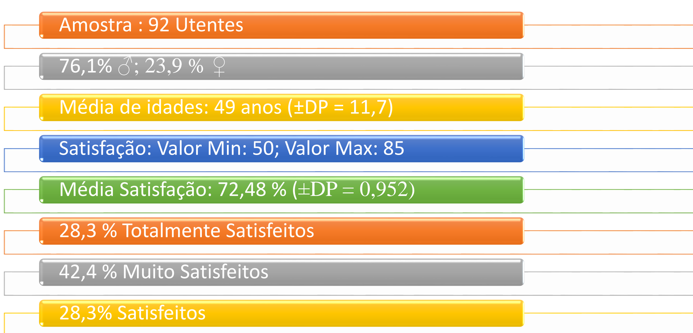
Fig. 1 – Caracterização da Amostra

Responderam ao questionário 92 utentes (76,1%♂), com uma média de idades de 49 anos. As estatísticas relativas à satisfação oscilaram entre valor mínimo de 50 e máximo de 85, sendo a média de 72,48%. Manifestaram-se: 28,3% totalmente satisfeitos; 42,4% muito satisfeitos e 28,3% satisfeitos. As áreas de maior satisfação foram atenção e apoio, e informação prestada.