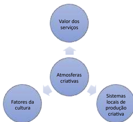
Figura 1 – A Estrutura da atmosfera criativa (elaboração própria).

As fábricas da cultura representam os principais atores e polos da economia cultural. Em conjunto com o valor dos serviços fornecidos por pequenas empresas e atividades criativas, constituem a estrutura da produção cultural e evidenciam a presença da especialização em produtos culturais específicos. Os sistemas locais de produção cultural são bastante úteis para destacar as conexões entre a atmosfera criativa, a atmosfera local, os sistemas culturais e a produção de serviços com valor cultural.