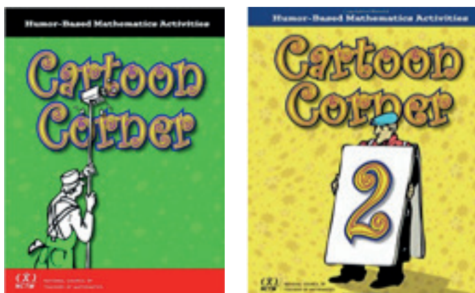
Figura 3. Livros sobre humor na Matemática (NCTM, 2007, 2013).

Nos dois livros da coleção “Cartoon Corner”, o NCTM (2007, 2013) apresenta um conjunto de tarefas matemáticas construídas a partir de tiras de banda desenhada alusivas à Matemática (figura 3). Para além disso, apresentam resoluções para algumas dessas tarefas.