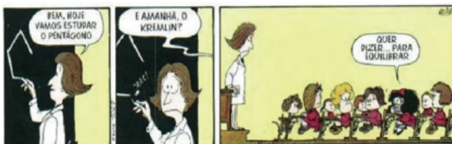
Figura 1. Tira de Mafalda, da autoria de Quino

Procurando compreender como opera o humor, têm sido desenvolvidas diversas teorias, provenientes de campos teóricos como, por exemplo, a Linguística, a Psicologia ou a Sociologia. De entre as teorias que apresentam mais trabalho, salientamos a da Incongruência, a da Libertação e a da Superioridade (Adão, 2016; Martins, 2015; Martin & Ford, 2018). Destas, pelo seu potencial no campo educativo, salientamos a teoria da Incongruência. Esta teoria explica o funcionamento do ato humorístico em três fases: primeira, o interlocutor é situado num determinado domínio de experiência que lhe é familiar; segunda, o interlocutor é confrontado com uma situação inesperada que é, de alguma maneira, incongruente com o domínio de experiência anterior; e terceira, o interlocutor resolve a incongruência e compreende a intenção engraçada do locutor (Adão, 2016). A figura 1 apresenta uma situação humorística gráfica que funciona de acordo com esta teoria da Incongruência: