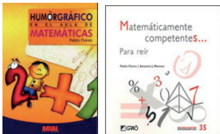
Figura 2. Livros sobre humor na Matemática (Flores, 2003; Flores & Moreno, 2011).

No livro “Humor gráfico en el aula de Matemáticas”, Flores (2003), na sequência de trabalhos anteriores (Flores, 1996, 1997, 1998), apresenta uma coleção de ilustrações de cariz humorístico que envolvem ideias matemáticas. A propósito delas tece considerações didáticas, dando sugestões de utilização em sala de aula.