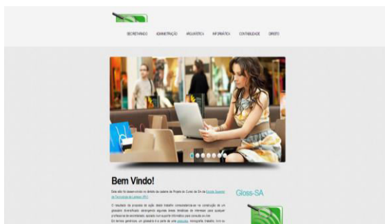
Figura 1: página de início do GlossSA

Nesta fase de proposta de implementação, considerámos que deveriam fazer parte do glossário as seguintes áreas: secretariado, administração, arquivística, informática, contabilidade e direito. Dada a abrangência da capacidade de assessoria que um secretário eficiente deve controlar, são apresentados conceitos que possam permitir a este profissional um domínio dos termos técnicos de diversas áreas profissionais.