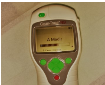
Figura 7 – Medição da amostra