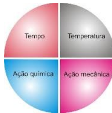
Figura 1- Círculo de Sinner