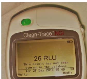
Figura 8 – Resultado em RLU