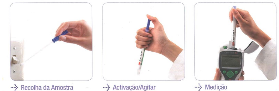
Figura 2 - 3M tm Clean-Trace- sistema de controlo de limpeza