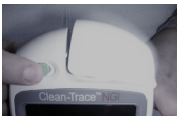
Figura 3 – Luminómetro

Baseadas no autor supracitado a técnica realizada, por opção, foi a centrífuga. No decorrer da colheita, foram seguidas as instruções de uso, que constam no Manual do Usuário (Care, 2013). As fotos seguintes têm como finalidade dar a conhecer o luminómetro e sua utilização. As mesmas são da autoria das investigadoras.