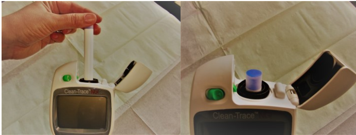
Figura 5 – Introdução do Swab