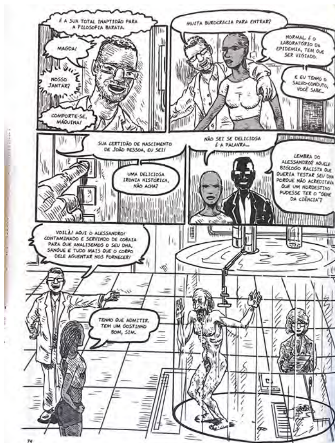
Figura 5 – racismo estrutural