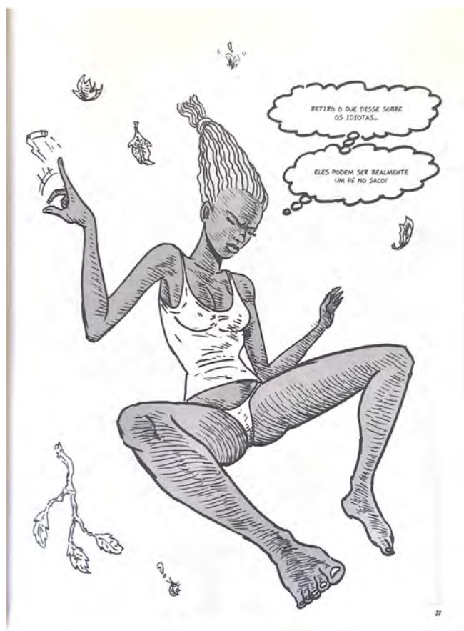
Figura 2 – ficção teatralizada da sexualidade

As escolhas narrativas em Magda contribuem para observar um discurso que resiste ao “sistema mundo” (Grosfoguel, (2009, p. 1) – quando discute a sujeição de nordestinos por parte de uma elite econômica sudestina –, mas, ao mesmo tempo, ecoa vozes patriarcais desse mesmo sistema quando coloca a protagonista em posições gráficas que reproduzem o discurso da ficção teatralizada da sexualidade discutida por Preciado (2020). As poses da protagonista ecoam o imaginário construído nos EUA pela Playboy , o qual apela “diretamente ao desejo sexual dos leitores” (Preciado, 2020, p. 27).