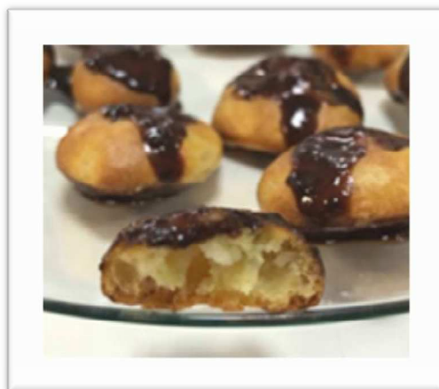
Figura 1. Beijinhos com cobertura de Chocolate.

Para a concretização do objetivo foram realizadas várias experiências, até que se obtivesse um produto com sabor agradável, textura adequada e características organolépticas desejáveis.