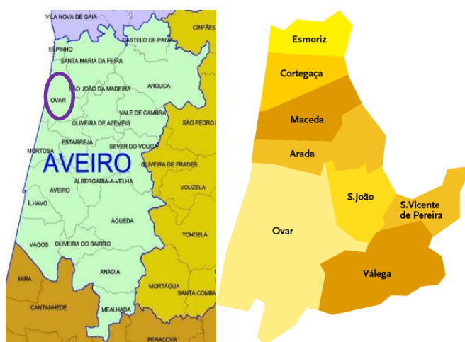
Figura 2 – Distrito de Aveiro e Concelho de Ovar