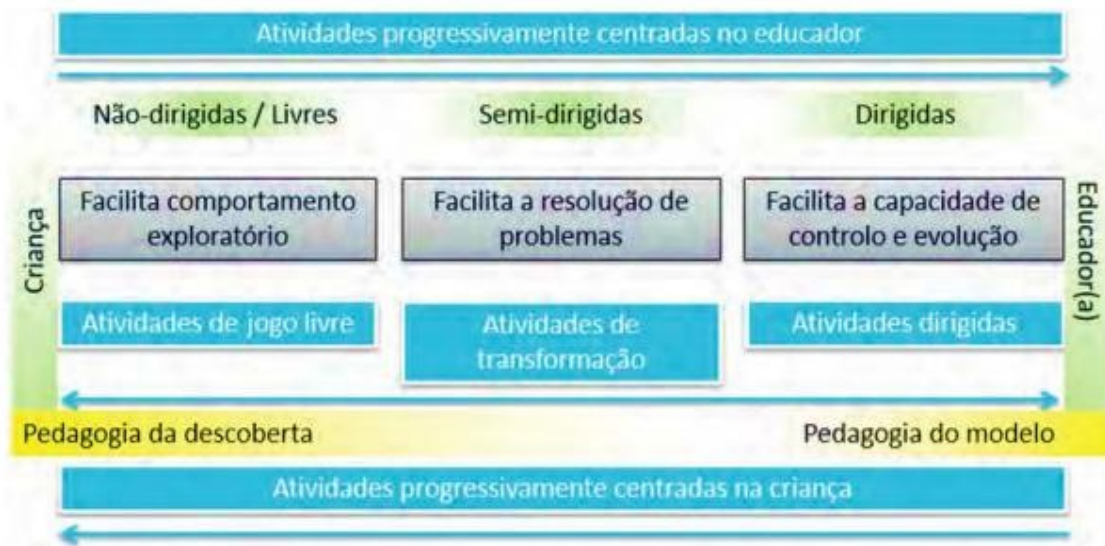
Figura 2 - Modelo de situação pedagógica (adaptado de Neto, 2020)

Deste modo, o movimento livre em contexto exterior reforça a confiança da criança no seu corpo, estimula a criatividade, potencia as interações sociais e promove uma aprendizagem integrada e significativa. A intencionalidade pedagógica na organização do espaço exterior traduz-se num ambiente mais rico, onde a criança explora, recria e amplia as suas experiências educativas (Neto, 2020).