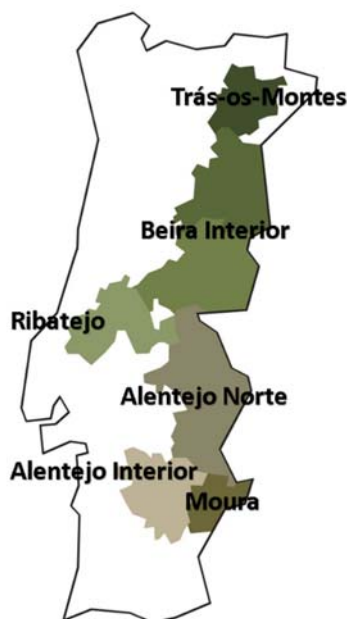
Figura 3 – Área de olival por Estados-Membros da EU

Tal como mencionado acima, em Portugal existem seis regiões DOP de produção de azeite. Todas elas estão localizadas no interior do país (Figura 3).