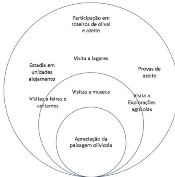
Figura 1 – Recursos da experiência turística do azeite Fonte: Murgado et al., 2011

Neste contexto, surge a necessidade de articular o olivoturismo com outras ofertas, como numa lógica multiproduto (articulação com a rota do vinho e outros produtos locais) (Bezerra & Correia, 2019).