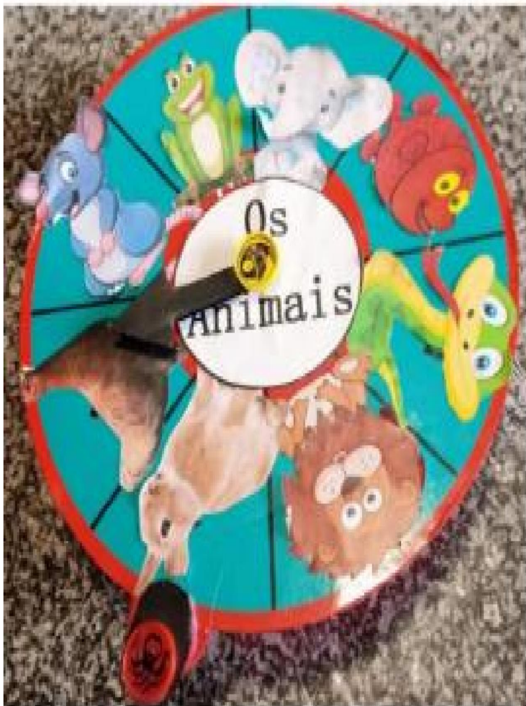
Anexo 7 – Exemplo de um dos materiais didáticos nas aulas dinamizadas