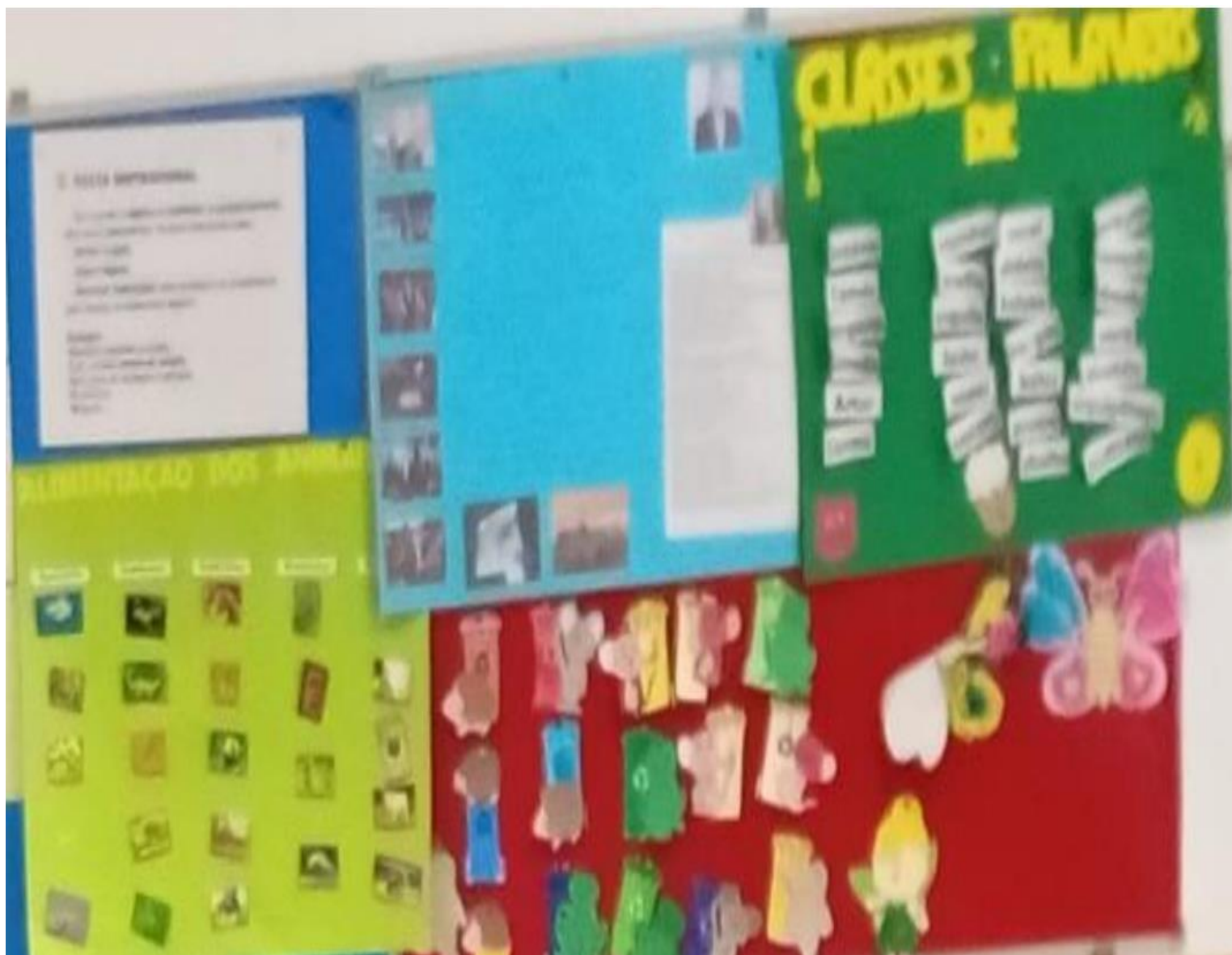
Anexo 11- Exemplo de cartazes elaborados durante as aulas dinamizadas