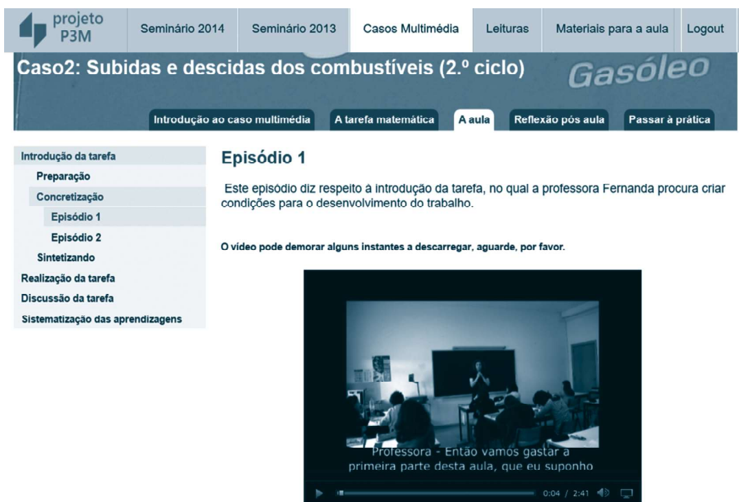
Figura 3. Vídeo do episódio da fase de concretização