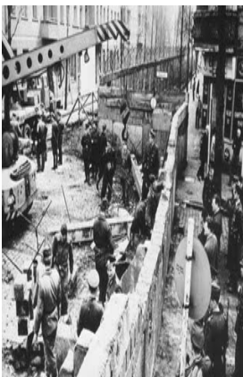
A construção do muro de Berlim 13 Agosto 1961

Apesar das tentativas de conciliação, a conferência acabou por ser interrompida. Os Quatro Grandes separam-se. A tensão reaparece. A atmosfera torna-se ainda mais pesada com as violentas acusações feitas por Khrushchev na Assembleia Geral das Nações Unidas, em Setembro de 1960. No encontro entre Kennedy e Khrushchev, que teve lugar em Viena entre 3 e 4 de Junho de 1961, o dirigente soviético volta a exigir a transformação de Berlim ocidental em cidade livre, propondo a assinatura de um tratado entre as duas Alemanhas. A crise atingiu o seu apogeu com a construção do muro de Berlim. As autoridades da Alemanha de leste construíram--no na noite de 12 para 13 de Agosto de 1961. Os sectores leste e oeste de Berlim têm agora uma barreira hermética.