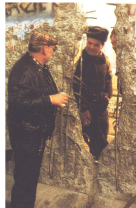
Queda do Muro de Berlim 1989

A Europa ficou imóvel perante a construção do muro, pois havia perdido a sua hegemonia mundial. Para desfazer esta situação, teríamos de esperar quase 30 anos e, para isso, muito contribuiu o novo líder soviético em 1985 - Mikhail Gorbachev, que traz consigo uma onda liberalista para o regime socialista, afectando outros no leste europeu. Contudo, a modificação económica e política não colhe bons frutos e resultaria no inevitável fim do muro de Berlim. A cortina de ferro cai como consequência natural das novas políticas soviéticas e do fim do regime de Erich Honecker na RDA. Foi a 9 de Novembro de 1989 que se derrubaram as primeiras pedras do muro por cidadãos com fome de democracia e unidade.