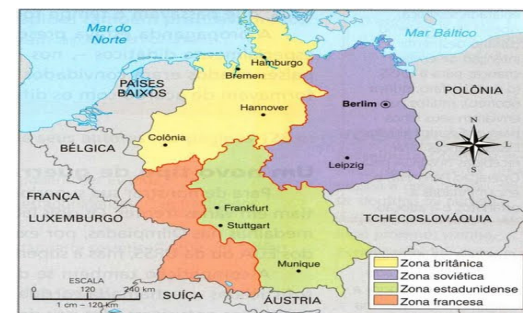
Divisão de Berlim no pós II guerra mundial

No pós II Guerra Mundial, Berlim fica sujeito a um estatuto quadripartido: são definidas 4 áreas, cada uma das quais ficando sob ocupação militar de uma das potências Aliadas da II guerra mundial - EUA, URSS, Reino Unido e França.