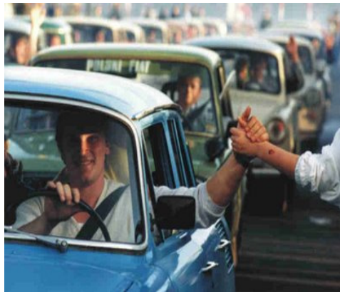
Abertura das fronteiras

Esta abertura possibilitou o alargamento do Acto Único Europeu ao leste da Europa. Assinado em 17 de Fevereiro de 1986, o Acto Único Europeu apontava como objectivo uma maior coesão económica e social. Poderá dizer-se também que o Acto Único consolidava a obrigação de realizar simultaneamente o grande mercado sem fronteiras, a coesão económica e social, uma política europeia de investigação e tecnologia e acções significativas em relação ao ambiente.