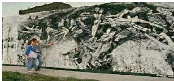
Graffiti feito no Muro