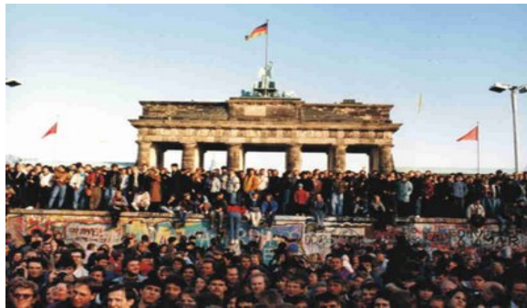
Celebração nas Portas de Bradenberg

A queda do muro e a consequente abertura a Ocidente, bem como o colapso do sistema comunista do leste Europeu permitiram que as fronteiras internas europeias fossem abertas.