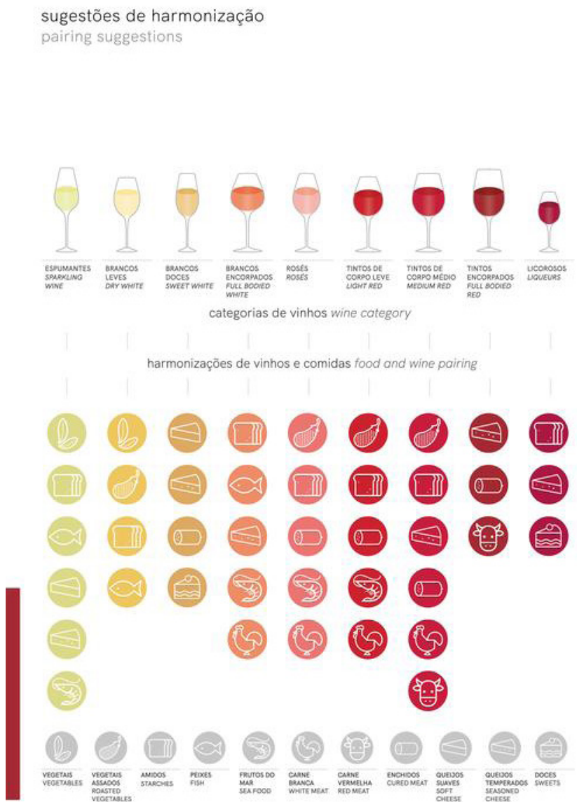
Figura 5 – Ficha Vinho: Sugestões de Harmonizações

harmonizações genéricas para espumantes, vinhos brancos leves, brancos doces, brancos encorpados, rosés, tintos de corpo leve, tintos de corpo médio, tintos encorpados e vinhos licorosos. A comida foi agrupada por características mais abrangentes, dando origem a vários grupos: vegetais, vegetais assados, amidos, peixes, frutos do mar, carne