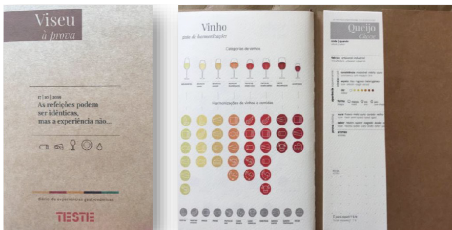
Figura 2 – Livro/teste experiências

Cada convidado à chegada tinha acesso a um pequeno livro com informações e as fichas de experiências para que pudesse testar e propor sugestões/alterações (figura 2). O design e a organização gráfica do livro/teste, e posteriormente do diário final (com as necessárias correções), foi elaborado por uma designer.