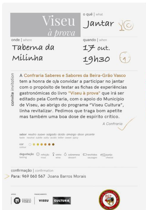
Figura 1 – Exemprar do convite para o jantar/teste final

Cada convidado à chegada tinha acesso a um pequeno livro com informações e as fichas de experiências para que pudesse testar e propor sugestões/alterações (figura 2). O design e a organização gráfica do livro/teste, e posteriormente do diário final (com as necessárias correções), foi elaborado por uma designer.