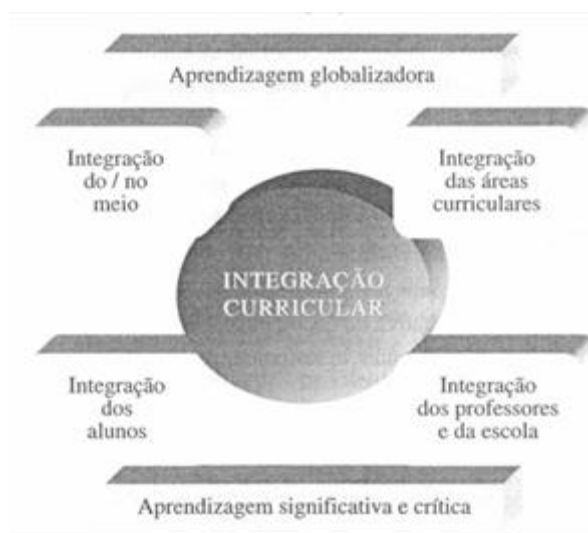
Figura 2 - Dimensões da integração curricular

Na Figura 2, apresentamos esquematicamente um modelo de integração curricular que nos permite verificar como, no estudo de questões relevantes que o projeto propõe aos alunos e professores, o meio se constitui como fonte de aprendizagem, em ligação com outras fontes e materiais, possibilitando articular o conhecimento escolar com o conhecimento cotidiano, utilizando os instrumentos conceptuais e procedimentais das áreas disciplinares ao serviço da compreensão crítica do mundo (Alonso, 2002).