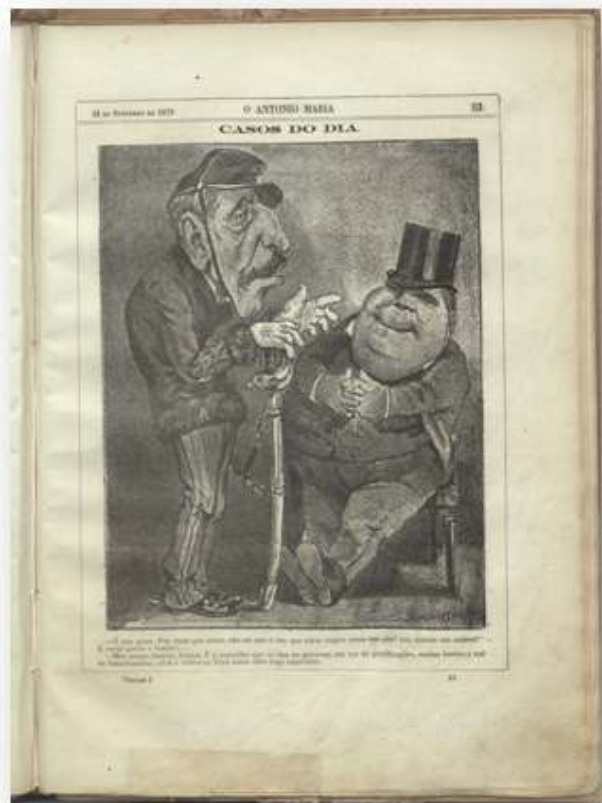
Fig. 4 - "O António Maria", 18 de Setembro de 1879 ( http://purl.pt/13854/3/j-415-b_1879/j-415-b_1879_item3/P105.html )

"- Ò seu prior, não sei que é isto que estou magro como um cão, sou mesmo um cadáver! E vossê gordo e luzidio. - Meu amigo, hóstias, hóstias. É o conselho que eu dou ao governo, em vez de gratificações muitas hóstias a todos os funcionarios civis e militares. Verá como elles logo engordam."