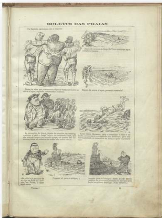
Fig.5 - "O António Maria", referência ao Bispo de Viseu, a banhos em Espinho ( http://purl.pt/13854/3/j-415-b_1879/j-415-b_1879_item3/P112.html )