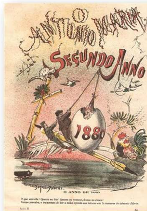
Fig.6 - "O António Maria". Capa do número que marca o início do ano de 1880.

A seguir a este período, o jornalismo português começa o século XX sob o signo da intensificação da censura à imprensa e da repressão sobre os jornalistas e jornais que desafiavam o poder, em particular sobre os republicanos. Os jornais incómodos eram judicialmente processados ou apreendidos, textos ou partes de textos censurados, alguns jornalistas e editores presos (por vezes em situação de incomunicabilidade) ou degredados.