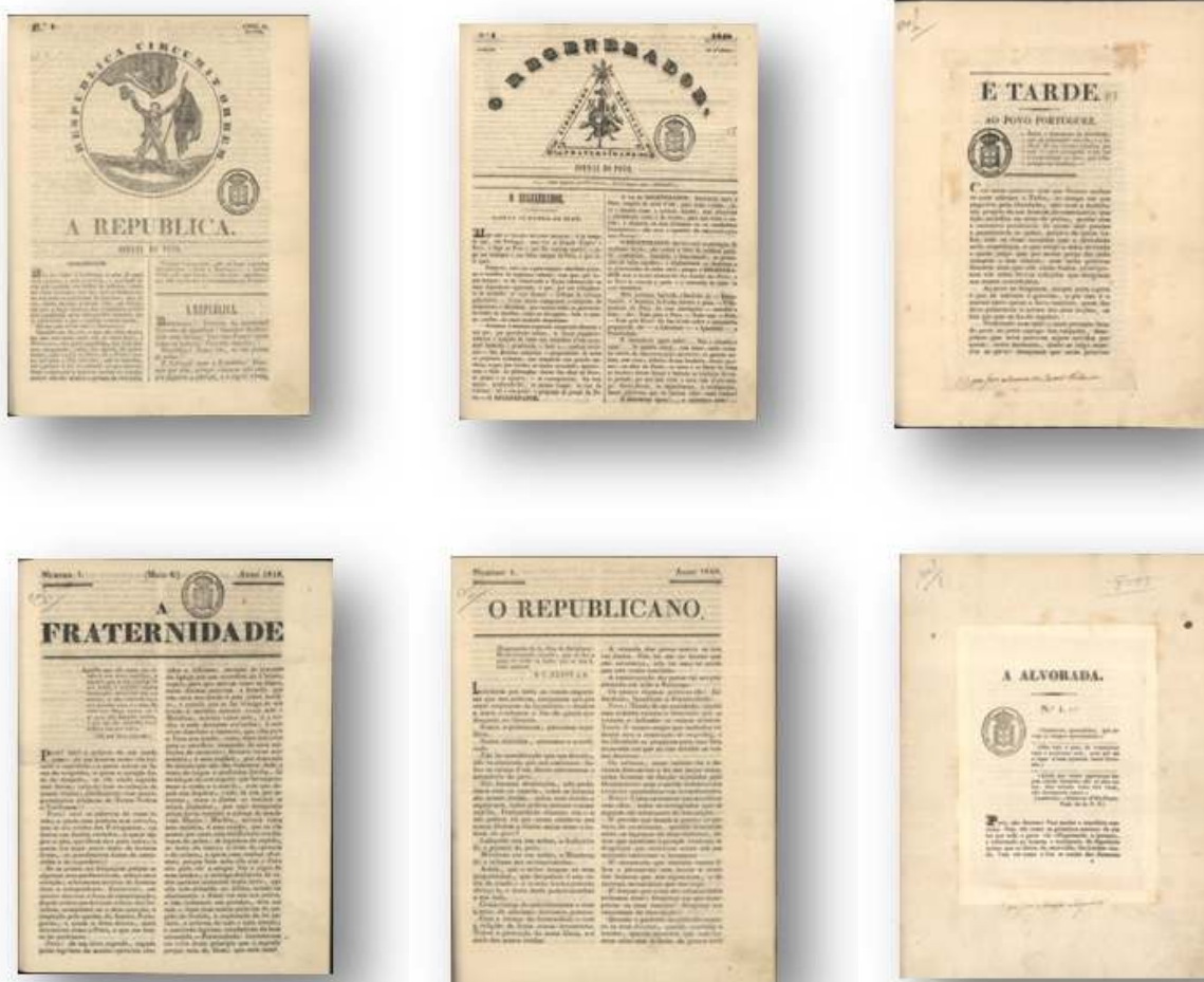
Fig. 2 - Primeiros números dos Jornais Século XIX em versão integral disponibilizados pela BND.

É neste contexto que se enquadra o projecto de divulgação, no âmbito da imprensa periódica portuguesa, de diferentes colecções que incluem cerca de 300.000 imagens de 22 títulos de jornais portugueses do século XIX. Entre estas colecções estão alguns dos periódicos portugueses, na clandestinidade, que ora referimos, "A República" (primeiro n.º 25 de Abril de 1848); "O Regenerador: Jornal do Povo: Liberdade, Igualdade, Fraternidade" (n.º 1 - 16 de Abril de 1848); "O Republicano" (s/d 1848); "É Tarde" (10 de Abril de 1848); "Fraternidade" (1848) e "O Alvorada" (Abril de 1848), todos eles em versão integral com acesso livre através da Biblioteca Nacional Digital ( http://purl.pt/index/geral/PT/index.html ou bnd.bn.pt. )