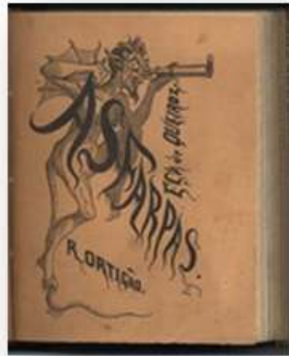
Fig. 3 - "As Farpas". Primeiro Número, 1871. ( http://purl.pt/256 )

Para além destas colecções salientam-se "As Farpas" ("As farpas: chronica mensal da politica das letras e dos costumes / Ramalho Ortigão, Eça de Queiroz. - 1871- s. 4, n.º 3 (Jun. 1883). - Lisboa: Typ. Universal, 1871-1883"). A 17 de Junho de 1871 aparecem nas bancas de Lisboa opúsculos, com cerca de 100 páginas, decorados com a imagem do diabo Asmodeus, génio impuro de que falam as Escrituras. Na vertical figurava o nome de Eça de Queirós, na Horizontal o de Ramalho Ortigão. A parte escrita por Eça foi publicada em 1890, em dois volumes com o título "Uma Campanha Alegre". "As Farpas" são uma admirável caricatura da sociedade da época. Altamente críticos e irónicos, estes artigos satirizam a imprensa e o jornalismo partidário ou banal; a regeneração e todas as suas repercussões, não só a nível político mas também económico, cultural, social e até moral; a religião e a fé católica; a mentalidade vigente, com a segregação do papel social da mulher; a literatura romântica, falsa e hipócrita. "As Farpas" tornaram-se num novo e inovador conceito de jornalismo - o jornalismo de ideias, de crítica social e cultural.