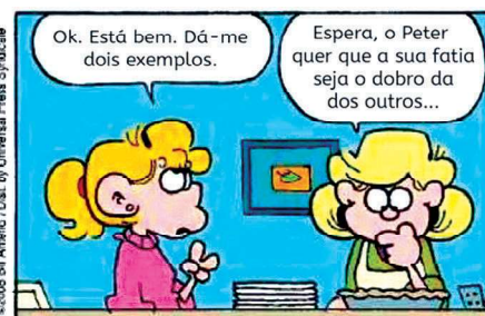
Figura 2. Tiras da autoria de Bill Amend.