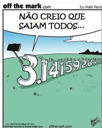
Figura 3. Ilustração da autoria de Mark Parisi (Menezes et al., 2020).

A ilustração da figura 3, da autoria de Mark Parisi, serviu de base à criação da tarefa intitulada “Ficar na fotografia”: