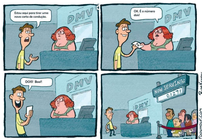
Figura 1. Tiras da autoria do gráfico norte-americano Ryan Kramer (Menezes et al., 2020).

Numa aula de 4.º ano, a professora propõe a tarefa intitulada “Quando o 2.º não é grande coisa” (Menezes et al. 2020), que parte da ilustração de natureza humorística da figura 1: