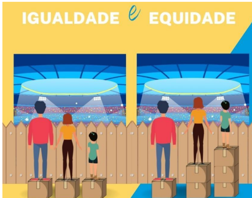
Figura 3 – Ilustração representando a igualdade e equidade

Nota: Silva, C. B. M. (2021). Qual a diferença entre igualdade e equidade?.