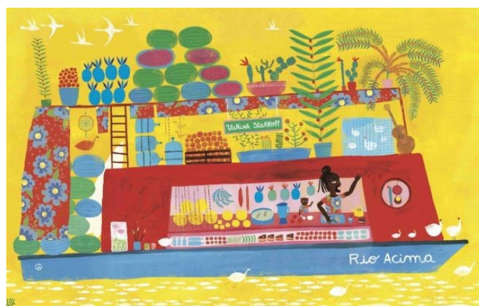
Figura 2. Capa de Rio acima (Starkoff, 2017)

No pórtico de acolhimento do livro – a capa (cf. Figura 2) – narram-se, já, quotidianos partilhados. A criatividade enquanto constructo plural ganha aqui forma, face ao retrato versátil do «barco-casa» que retém o olhar dos leitores. Se o amarelo vai banhando a capa e a contracapa, parecendo-se prolongar-se no toque favorecido pelo seu manuseio, a seleção da paleta cromática abre outros caminhos de indagação sobre tudo o que está à vista: melancias e ananases azuis e verdes são vizinhos de plantas de diferentes espécies, devidamente acomodadas em vasos coloridos enquanto um homem e um gato preparam uma refeição e vão acenando a quem passa (e aos leitores, num processo de empatia invulgarmente bem conseguido).