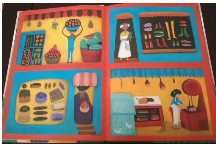
Figura 1. Dançar nas nuvens (Starkoff, 2010)

Os movimentos que atravessam o sonho e a dança, escutados, com intensidade, através da narrativa na primeira pessoa («Sonhava e dançava, dançava e sonhava»), repercutem-se, ainda, na sua aldeia, cujo crescimento surge intrinsecamente ligado a tais movimentos. Este crescimento é retratado, de forma notável, através de ilustrações que, no silêncio do texto, encontram espaço amplo para mostrar, com detalhe, alguns dos novos habitantes da aldeia e seus respectivos locais de trabalho: uma frutaria, uma padaria/pastelaria, um talho e uma oficina de sapatos. O cuidado colocado em cada retrato permite que os leitores: i) se deleitem com as cores e os cheiros que emanam das melancias e dos ananases, enquanto o seu olhar se detém na redescoberta dos vegetais em exposição; ii) se questionem sobre o tipo de pão e de bolos, de formatos, cores e tamanhos distintos que a montra da padaria/pastelaria ostenta; iii) apreciem a invulgar diversidade de sapatos/botas/chinelos em exposição na oficina de sapatos; iv) se demorem nos pormenores retratados no talho apresentado, onde prima a ordem e a arrumação. Diante dos leitores, apresenta-se, pois, um belo quadro cujas molduras possibilitam delinear a espacialidade representada, realimentando, também, a curiosidade e os sonhos (Cf. Figura 1):