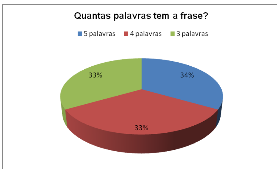
Figura 1 - Resposta à 1ª tarefa

Após o desenvolvimento da atividade e a observação direta das crianças, podemos verificar na figura n.º 1 o seguinte: