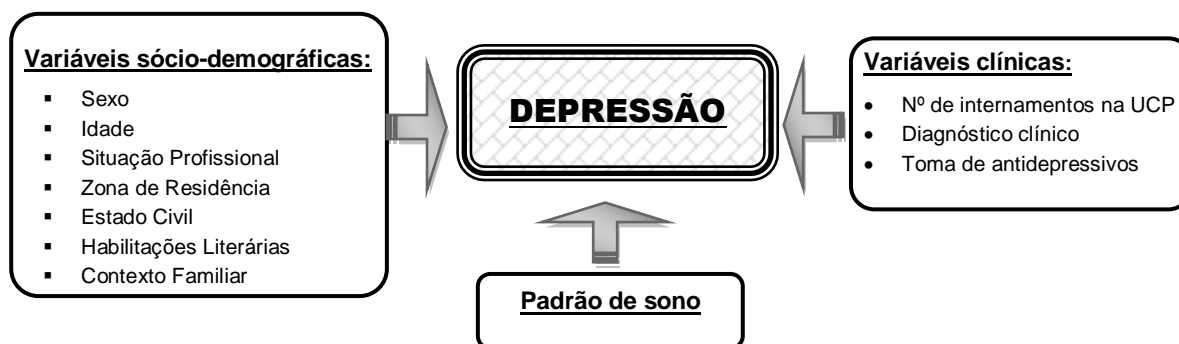
Figura 1 – Representação esquemática da relação prevista entre as variáveis

O estudo realizado, nesta pesquisa, foi de cariz transversal, explicativo descritivo, analítico, retrospectivo e correlacional.