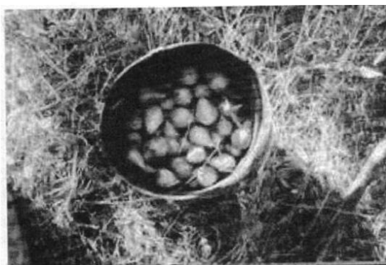
Figura 1: pêras da variedade S. Bartolomeu

Esta variedade, ao contrário da maioria das pêras de consumo que possuem um sabor doce e macio, não possui um paladar suficientemente agradável para ser consumida em fresca, daí a necessidade desta passar por um processo de secagem, processo este essencialmente artesanal, de modo a ser colocada no mercado comercial. Este procedimento de secagem é realizado de uma forma bastante simples em locais artesanais preparados pelo agricultor, através da secagem directa ao ar livre pela radiação solar. Esta metodologia implica assim a utilização de bastante mão-de-obra para as operações de apanha da pêra, descasque e espalma entre outras, com o inconveniente associado pela forte dependência das condições climatéricas.