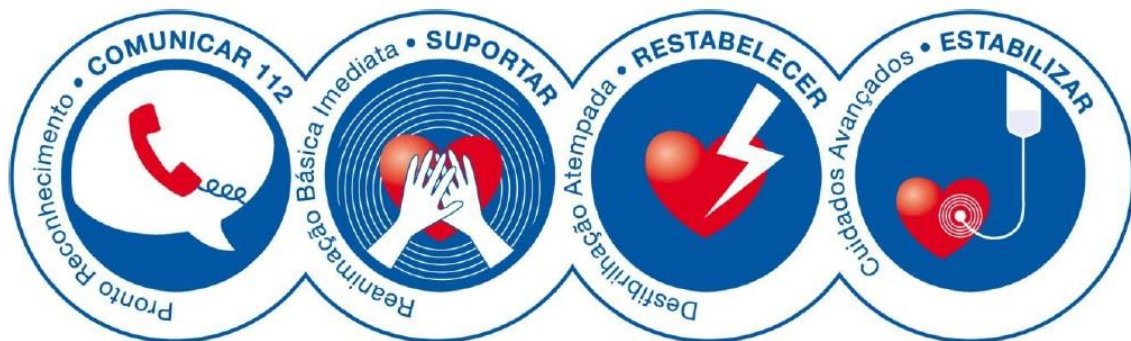
Figura 1. – Cadeia de Sobrevivência da Vítima Adulta