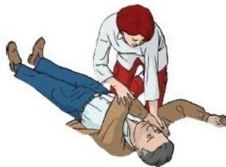
Figura 6. – Cruzar o braço para a PLS

De seguida, seguramos o braço mais afastado cruzando o tórax e fixamos o dorso dessa mão na face da vítima do nosso lado.