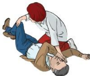
Figura 7. – Rolamento final para PLS

Com a outra mão é levantada a perna do lado oposto acima do joelho dobrando-a, deixando o pé pousado no chão.