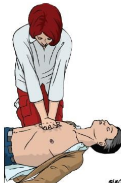
Figura 2. – Posição Reanimador/Vítima e posição para as mãos no tórax.

Este gesto deve ser firme, controlado e executado na vertical.