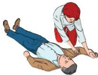
Figura 5. – Posição inicial em PLS

Com as pernas da vítima estendidas, vamos colocar o braço mais perto em ângulo reto com o corpo, e com o cotovelo dobrado e a palma da mão virada para cima.