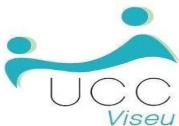
Figura 1 – Logotipo da UCC Viseu